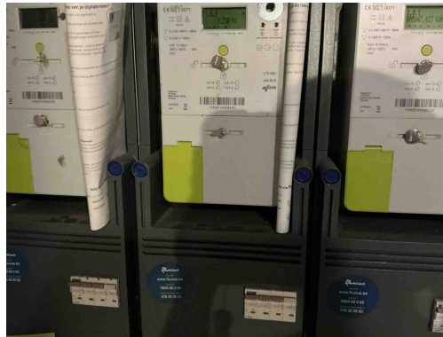
Geen gekoppelde inbreuk